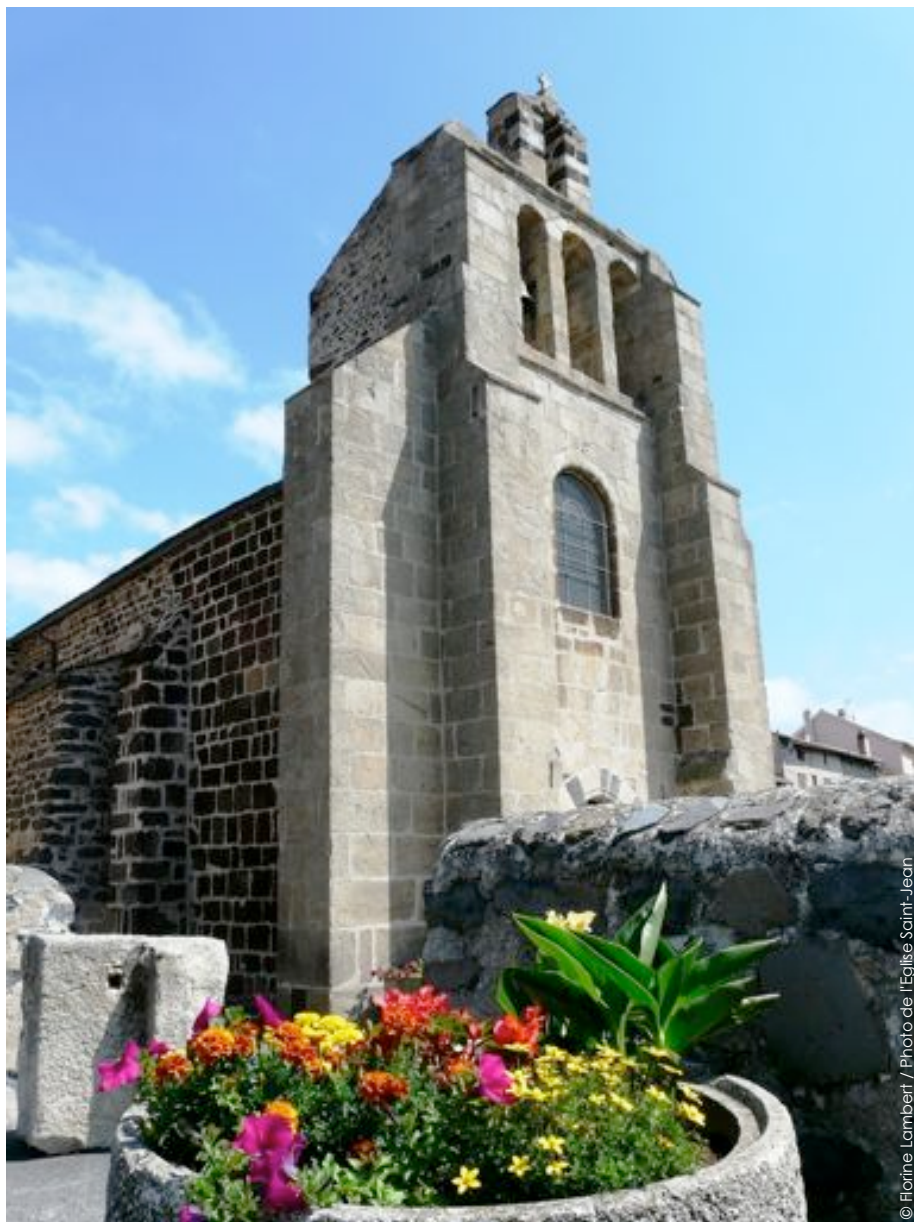
Photo de l'Eglise Saint-Jean